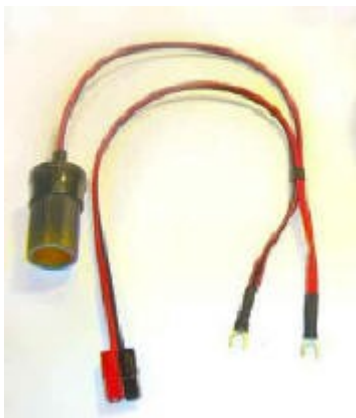
DC-uttag och Power Pole för batt. Anslutning.