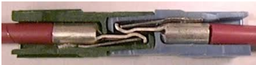
Kontakterna sammansatta, obs låsfjädrar och kontaktytan.

Very important that the contact is snapped over the end of the spring as shown here.