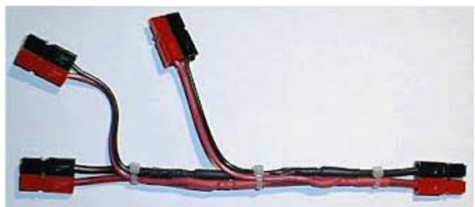
Skarvkabel med delning för tre anslutningar.