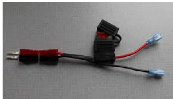
Batt. Anslutning säkring och Power Pole.